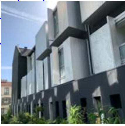
Le Lavoir Numérique, façade moderne © Arteo architectures - Cécile Septet